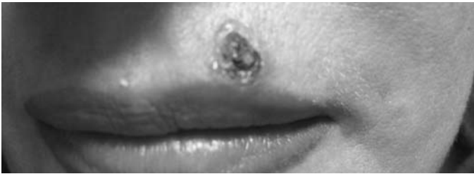
Рис. 1. Язвенная разновидность нодулярной формы базально-клеточного рака кожи. Проведена лазеротерапия углекислотным лазером «Ланцет» (мощность излучения 20 Вт, режим супер-импульсный, 0, 002 сек.), наружно гель «Эгаллохит» («Галадерм»).