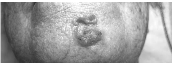
Рис. 7. Язвенная разновидность нодулярной формы, метакронный очаг базально-клеточного рака кожи в области подбородка. Проведена фотодинамическая терапия, наружно крем «Эгаллохит» («Галадерм»).