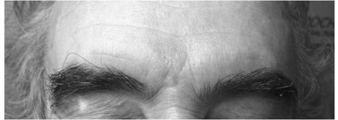
Рис. 4. Через 1 год после лечения имеется стойкий нормотрофический рубец, при осмотре рецидива не отмечается.