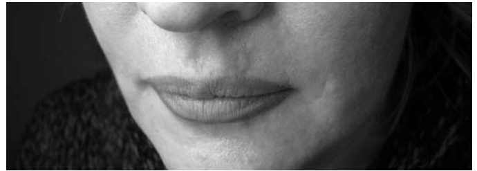
Рис. 2. Через 2 года после лечения имеется стойкий нормотрофический рубец, при осмотре рецидива не отмечается.