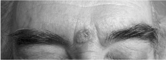
Рис. 3. Нодулярная форма базально-клеточного рака кожи в области переносицы. Проведена лазеротерапия диодным лазером «Диолан» (мощность излучения 25 Вт, режим импульсно-периодический, 0,2 сек.), наружно крем «Эгаллохит» («Галадерм»).