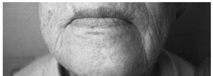
Рис. 8. Через 1 год после проведения фотодинамической терапии имеется стойкий нормотрофический рубец, при осмотре рецидива не отмечается.